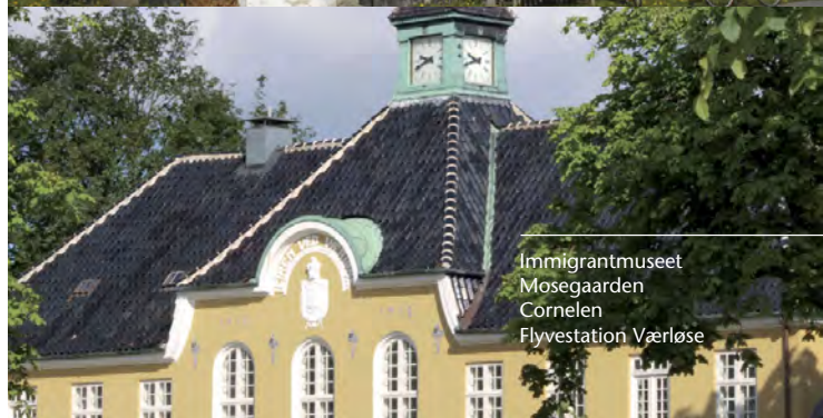
Immigrantmuseet Mosegaarden Cornelen Flyvestation Værløse