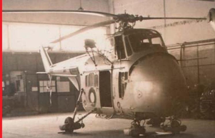
Eskadrille 722s redningshelikoptere var et kærkommet syn for folk i havsnød. Her ses en Sikorsky S-55 i Hangar 2.

Historien omkring Flyvestation Værløse blev endnu engang formet af verdenshistoriens gang, da Berlinmurens fald i 1989 signalerede