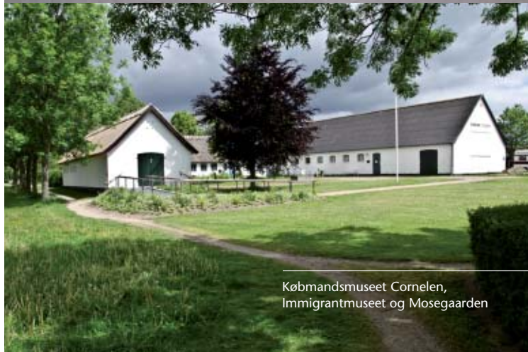
Købmandsmuseet Cornelen, Immigrantmuseet og Mosegaarden