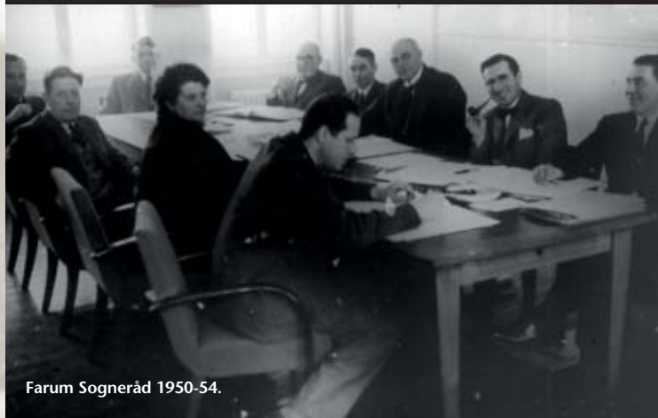
Farum Sogneråd 1950-54.