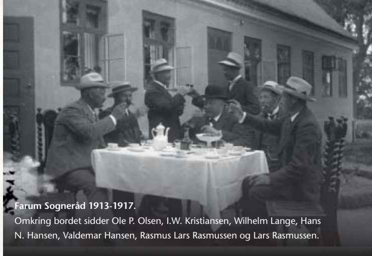
Farum Sogneråd 1913-1917.

Oplev denne historie og meget mere i Furesø Museers nye særudstilling om Farum på Mosegården i Værløse.