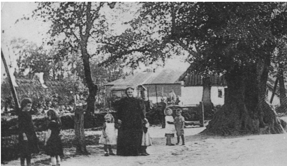
Børn fra asylet ved det store træ, Majtræet. Majtræet kan du stadig se på Farum Hovedgade.

"Da jeg var blevet 7 år, skulle jeg begynde at gå i "den store skole", som vi kaldte Farum Skole. Jeg var selvfølgelig glad for at have nået det mål. Nu var jeg en rigtig skoledreng, som gik i skole sammen med de store drenge, i stedet for at være en asylunge* og være kammerat med alle de små unger.