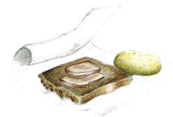
Madpakke med fedtemad, to stykker flæsk og en kartoffel.