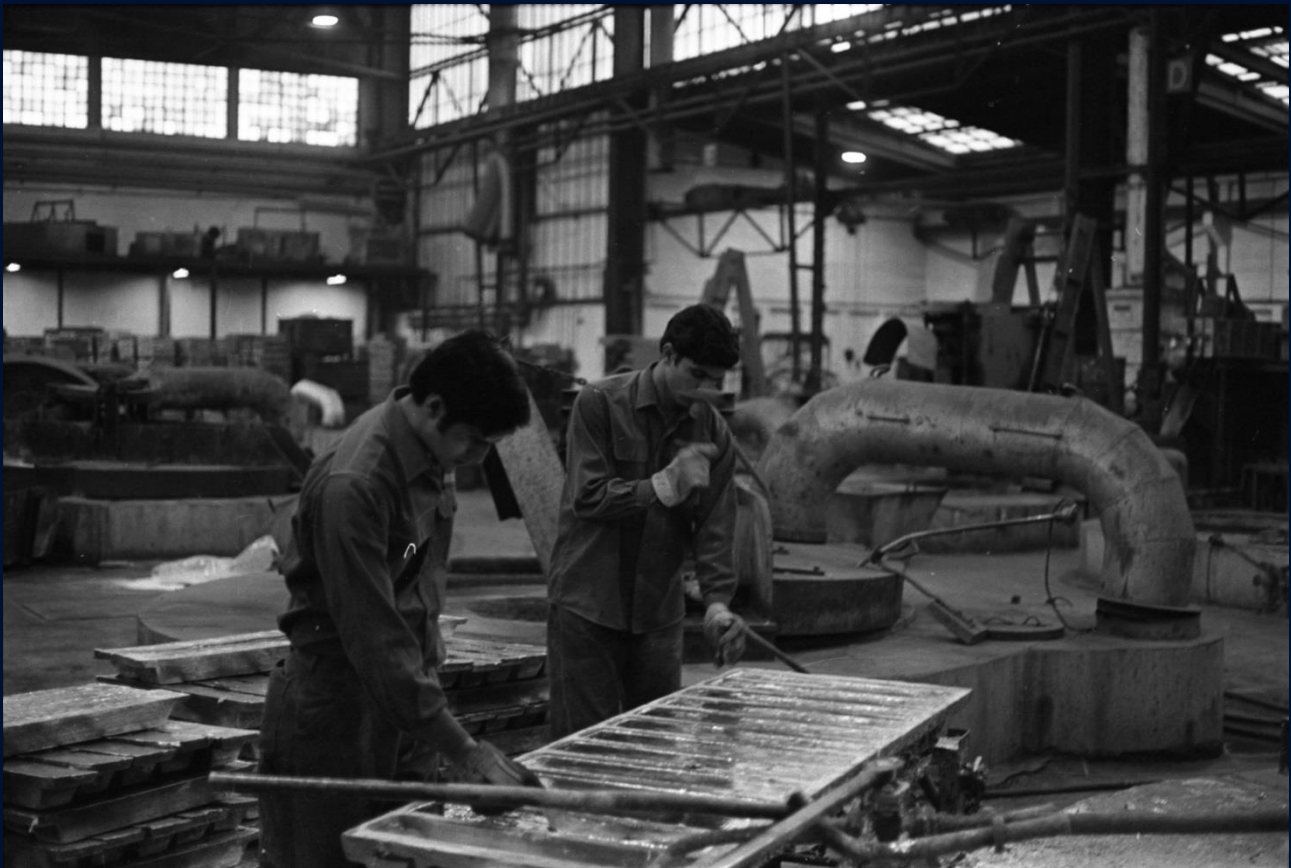
Tyrkiske gæstearbejdere i den danske industri 1970

Læs de tre interviews på den næste side og snak i klassen om, hvilke oplevelser de har haft i deres jobsituation i Danmark.