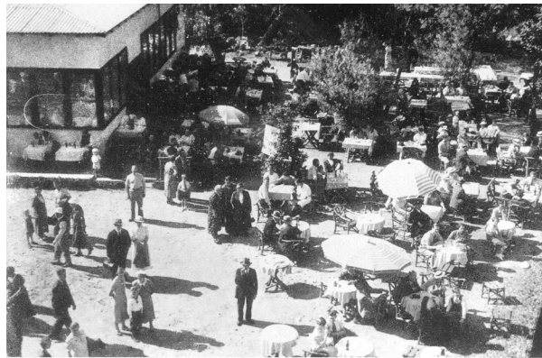
FURESØ BAD — FISKEBÆK pr. FARUM