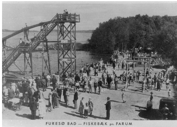
FURESØ BAD — FISKEBÆK pr. FARUM