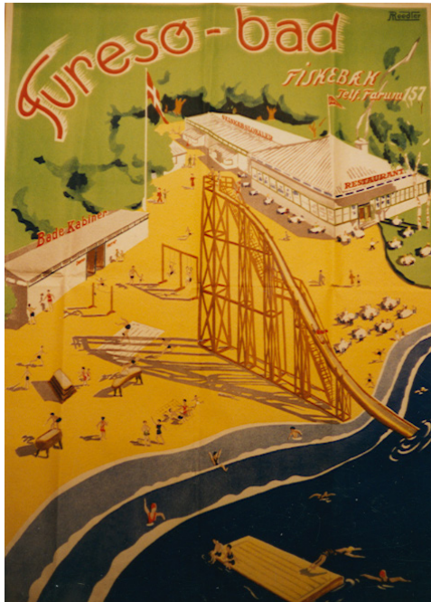
Plakaten med Furesøbad og den ikoniske rutsjebane er fra 1941.