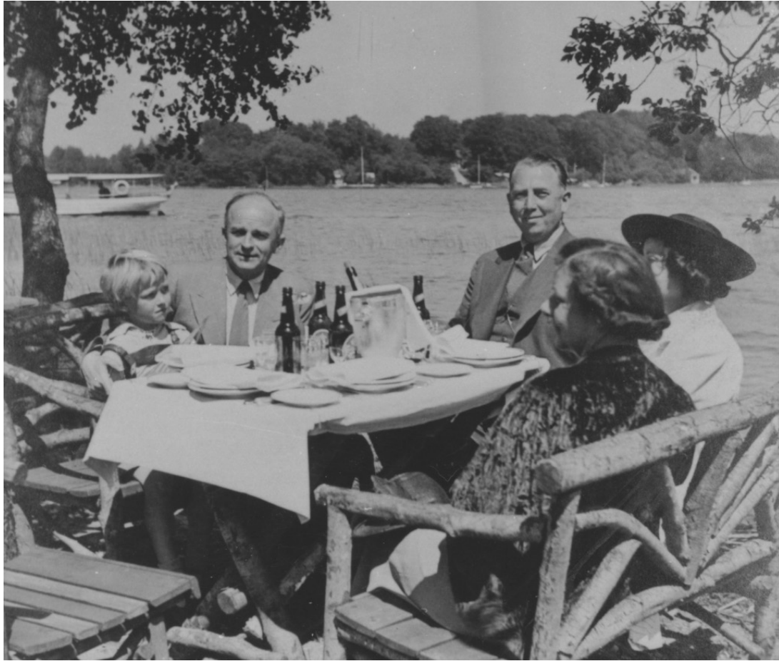
En sommerudflugt som den kunne se ud ved Furesøbad i 1939. Her kunne rejsegrammofonen godt have været del af udstyret.

lyder fuldstændig ens, hvad enten den spilles via en smartphone i Gambia eller en computer et sted i Farum.