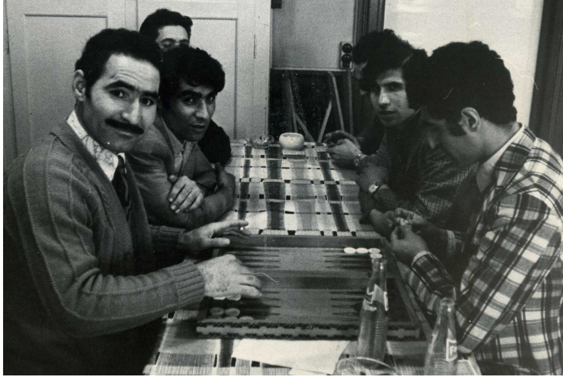
Tid til et spil backgammon på Vesterbro.

“ DET ER PUDSIGT, AT DE TYRKISKE MÆND KAST- EDE SIG OVER MADBRANCHEN. MANGE AF DEM VAR UERFARNE I ET KØKKEN, MEN OMVENDT VAR KVALITETEN AF FASTFOOD IKKE SPECIELT IMPO- NERENDE DENGANG. DER ER IMIDLERTID IKKE SKET MEGET SIDEN DA.