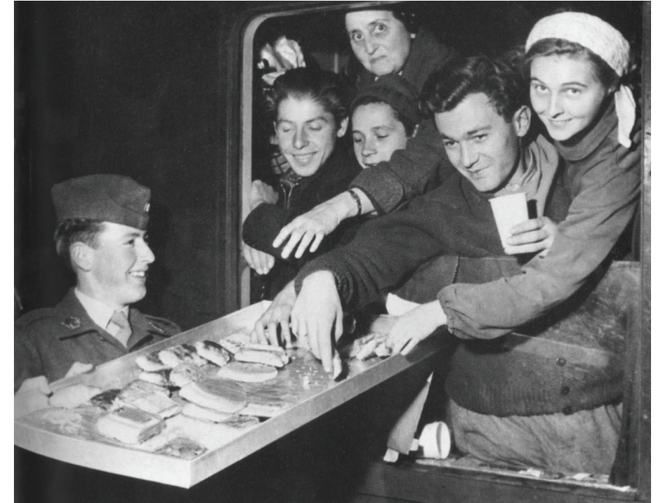
Ungarske flygtninge i 1956. Hvem skal konventionen beskytte? Kan man sige, at alle på flugt er flygtninge?

Vi forventer at kunne teste materialet på ungdomsuddannelser og de ældste klasser i udskolingen i februar 2022, hvis coronasituationen ellers tillader det.