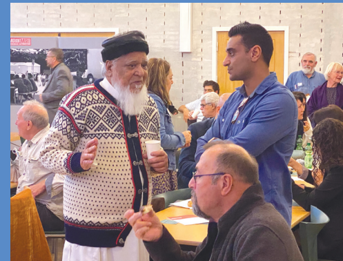
27. november 2021: Guldbryllup med Danmark. Immigrantmuseet og indvandrerhistorisk Selskab indbød til reception for at markere 50-året for den danske regerings stop for arbejdskraftindvandring, 50-året for udgivelsen af den første udgave af Fremmedarbejderbladet samt 40-året for dannelsen af INDSam