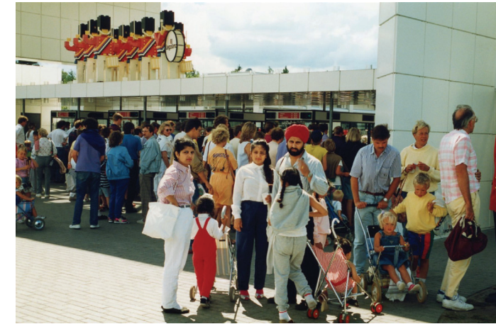
Sikh-familie foran indgangen til Legoland i Billund i 1995

“DET ER ESSENTIELT AT FORTÆLLE MIGRANTHISTORIER SAMT AT FORMIDLE DE KULTURELLE DIMENSIONER AF MIGRATION OGSÅ UDEN FOR MUSEETS FASTE RAMMER I FARUM”