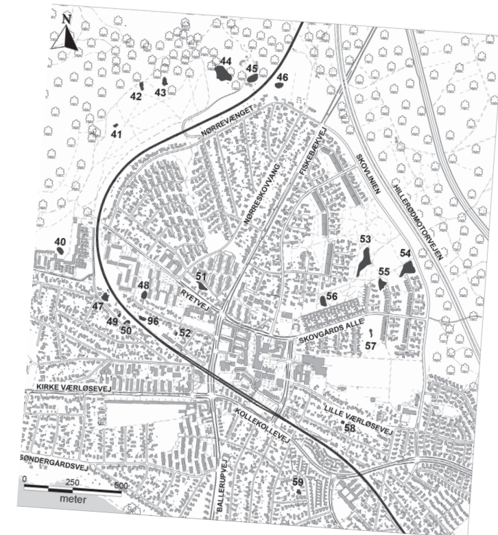
Stadsarkivet arbejder med at indsamle og sikre bevaringen af Furesø Kommunes papirskabte og digitale myndighedsdata

Med kommunens arkivalier får vi således en guldgrube af originale kilder til lokalsamfundets virke, historie samt kommunens borgere. Alt sammen vigtige brikker i vores fælles lokale hukommelse.