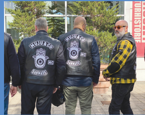
4. september 2021: Immigrantmuseet fik besøg af Mc MuJu & co, motorcykelklubben med særligt fokus på at fremme forståelse, samvær og interesse for motorcykler blandt religiøse-etniske minoriteter