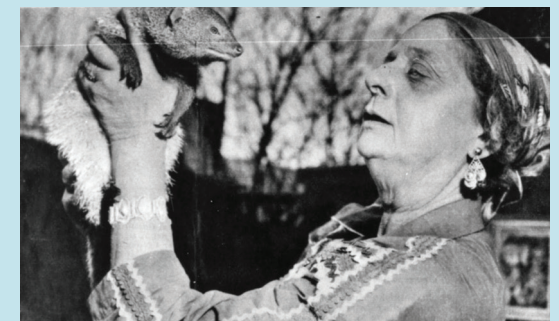
Om vinteren, når kulden blev for slem, fik flere af dyrene ophold i huset. Det satte sit præg på den hjemlige atmosfære