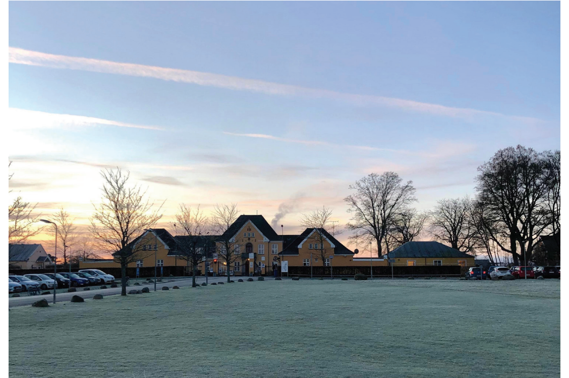
Den gamle Sandholmlejr lidt uden for Allerød huser i dag Danmarks største asylcenter. De kendte gule bygninger har for mange af de evakuerede afghanere været en del af det første møde med Danmark. Her startes tilværelsen i et nyt land langsomt op med sprogskole, børnehave, praktik og fritidsaktiviteter.

At indsamle genstande fra migranter og flygt-