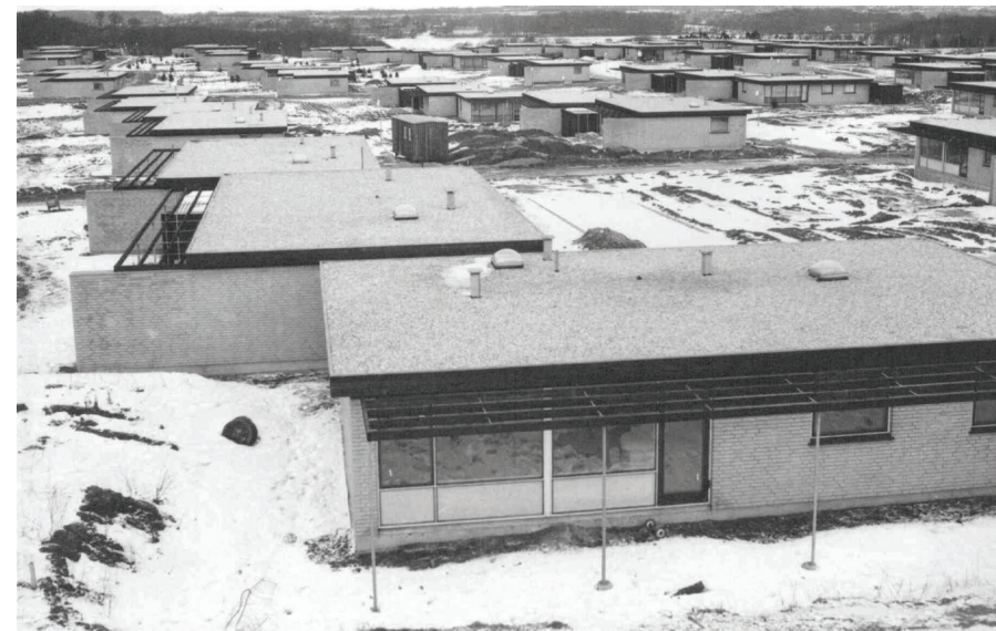
Mange unge familier fra København søgte i 1960'erne og 1970'erne mod Farum og Værløse. I de to kommuner skød række- og parcelhuse op. Blandt andet rækkehuskvarteret Bavnehøjpark i Værløse. Foto ca. 1972.

Udstillingsprojektet “Vores Historie” begynder den 3. maj, hvor museets campingvogn vil blive parkeret/gøre holdt i Hareskovby. Her vil museet indsamle viden og effekter. Kommende arrangementer og begivenheder vil løbende blive offentliggjort i pressen og på de sociale medier.