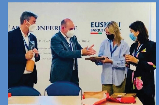
4. oktober 2021: Furesø Museernes chef fortsætter formandskabet for AEMI, det europæiske netværk for European Migration Institutions