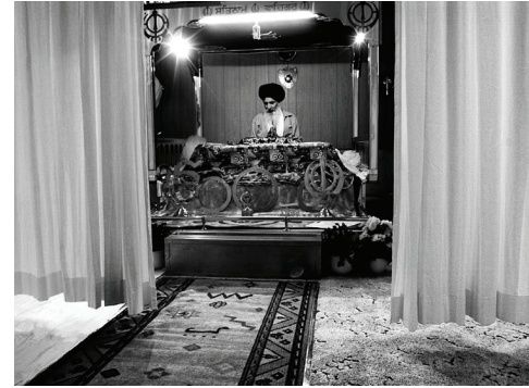
Den første gurdwara (tempel for sikher) i Vanløse

Det udforsker vandrestillingen gennem fortællinger om sikhismens kulturelle aspekter og sikhernes hverdagsliv, f.eks. gennem musik, mad, sammenhold, afsavn osv. Fokus er vel at mærke sikherne i Danmark, men problemstillingerne vil en arbejdsmigrant fra Polen eller en syrisk flygtning sandsynligvis også kunne nikke genkende til. Immigrantmuseet håber også i fremtiden at kunne lave lignende aktiviteter som vandrestillingen i Aarhus. Og det på tværs af landet. Det er essentielt at fortælle migranthistorier samt at formidle de kulturelle dimensioner af migration også uden for museets faste rammer i Farum.