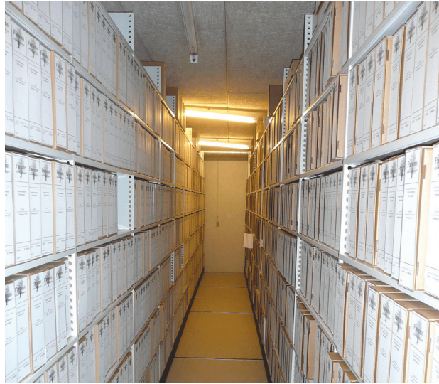
Stadsarkivet er på mange måder "kommunens hukommelse"

“ MED KOMMUNENS ARKIVALIER FÅR VI EN GULDGRUBE AF ORIGINALE KILDER TIL LOKALSAMFUNDETS VIRKE, HISTORIE SAMT KOMMUNENS BORGERE